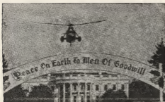
Un helicóptero con President Kennedy a bordo ta pasando riba e "Pagant of Peace", na Washington, despues di a lande na Casa Blanca den direccion di Base Andrews, en Maryland.